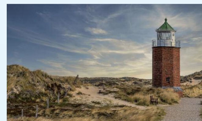
Leuchtturm auf Kampen.

Am Morgen erreichen Sie Haarlem, eine der charmantesten Städte der Niederlande. Die historische Stadt blickt auf eine lange und bewegte Geschichte zurück und war einst ein bedeutendes Zentrum für Kunst, Tuchhandel und Brauereien. Heute begeistert Haarlem mit malerischen Gassen, idyllischen Innenhöfen und einer lebendigen Kulturszene. Zu den Höhepunkten zählen die imposante Grote Kerk auf dem Marktplatz mit ihrer berühmten Müller-Orgel, das Frans-Hals-Museum, das traditionsreiche Teylers Museum – das älteste Museum der Niederlande – sowie die historische Windmühle „De Adriaan“. Entlang der Grachten und rund um die alten Stadttore lässt sich das besondere Flair dieser Stadt besonders eindrucksvoll erleben.