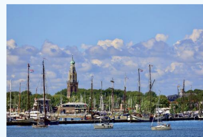
Das pittoreske Städtchen Enkhuizen im Norden der niederländischen Provinz Nordholland.

Die Hansestadt Nijmegen liegt in einer malerischen Flusslandschaft zwischen Rhein, Maas und Waal und bezeichnet sich selbst als die älteste