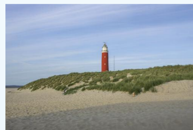
Die Nordseeinsel Texel im Nordosten der Niederlande besticht mit einer vielfältigen Naturlandschaft.

bewegte Geschichte zurück. Direkt am Hafen empfängt Besucher die Statue der sagenumwobenen „Frau von Stavoren“, die mit ihrem spitzen Hut sehnsuchtsvoll über das Wasser des IJsselmeers blickt. Wasser prägt das Bild der charmanten Hansestadt, die wegen ihrer maritimen Atmosphäre auch als „Kopenhagen Frieslands“ bezeichnet wird. Neben den farbenfrohen Häusern am Hafen gibt es hier noch vieles mehr zu entdecken: das moderne Blockhaus – einst Teil einer Festungsanlage von Karl V. –, einen Brunnen in Form eines riesigen Fischkopfes sowie das gemütliche historische Stadtzentrum.