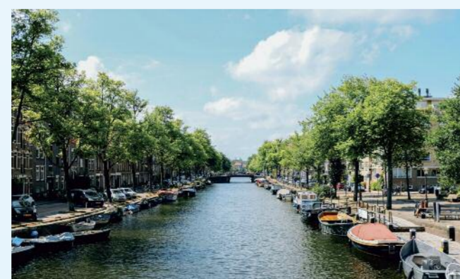
Die Grachten von Amsterdam.

Stavoren, die älteste Stadt der Provinz Friesland, blickt auf eine lange und