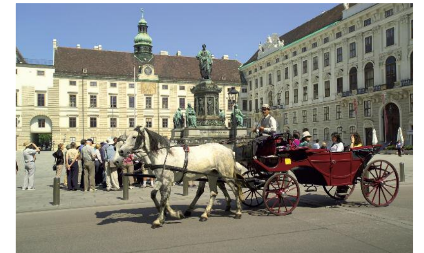
Fiaker vor der Wien Hofburg.