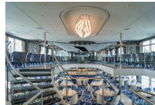
Der lichtdurchflutete Panorama Salon.