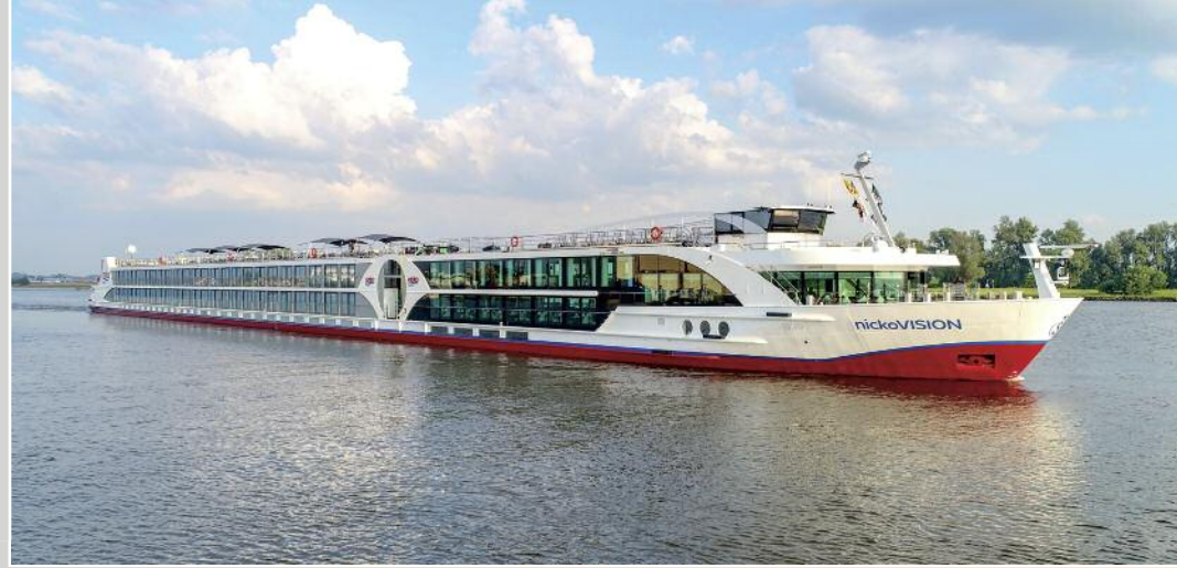
Die neue nickoVISION.