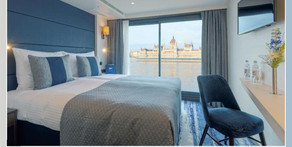
Kabine Mittel- und Oberdeck.