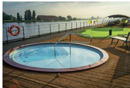
Whirl Pool auf dem Sonnendeck.

Das Schloss Schönbrunn ist eines der bedeutendsten Kulturgüter und gehört bereits seit den 1960er Jahren zu den meist besuchten Sehenswürdigkeiten in Österreich. In der ehemaligen Sommerresidenz der Habsburger kann man die Prunkräume der