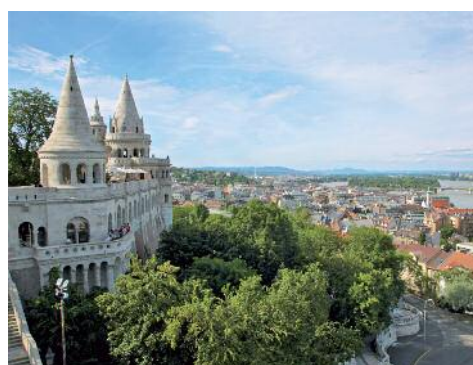
Die Fischerbastei in Budapest.