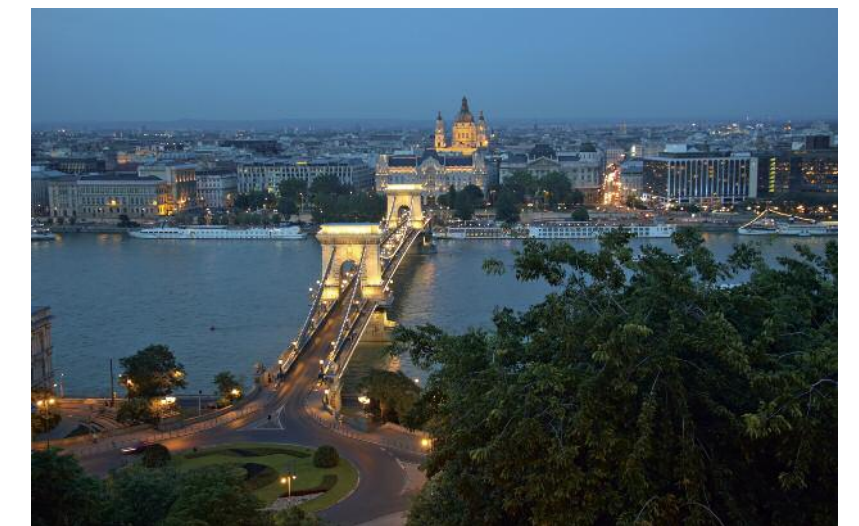
Die Kettenbrücke in Budapest bei Nacht.