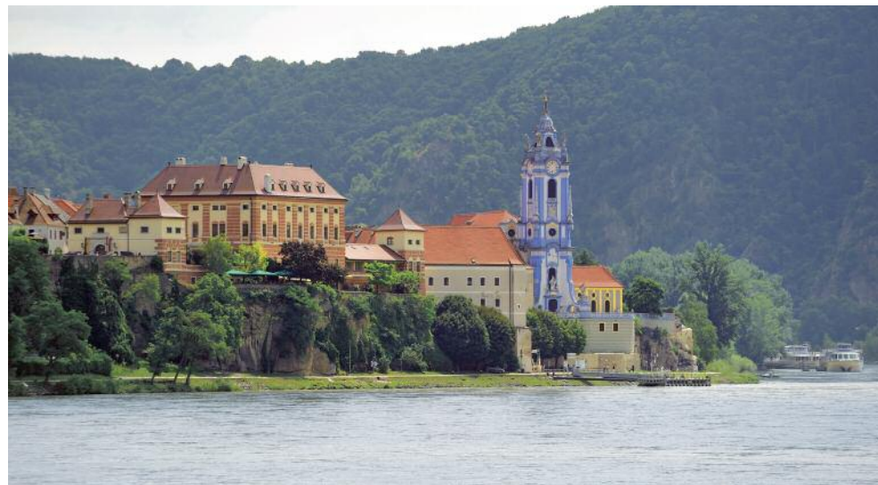
Kreuzen durch das UNESCO-Welterbe Wachau.

Für diese Reise benötigen deutsche Staatsbürger einen gültigen Personalausweis oder Reisepass. Ohne gültige Ausweisdokumente kann die Reise nicht angetreten werden.