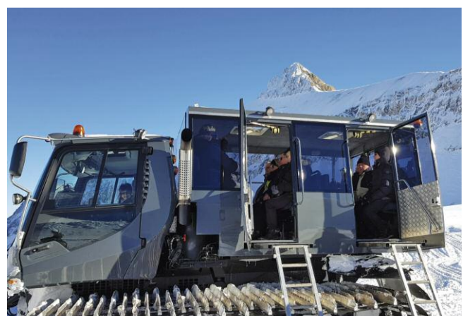
Im Schneebus Glacier 3000 bergan.