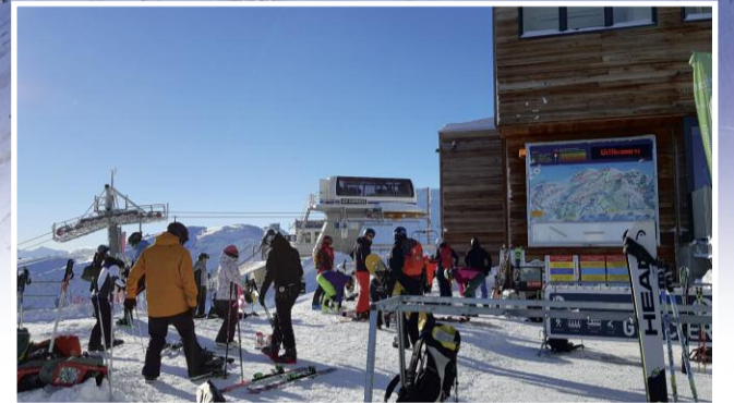
Oben am Glacier 3000 angekommen.