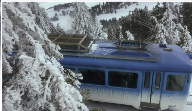
Mit der Rigi Bahn unterwegs.