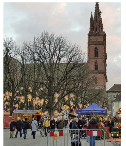
Auf dem Weihnachtsmarkt in Basel.