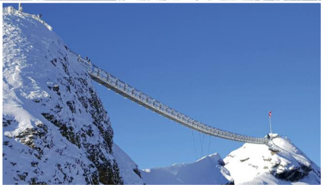
Die Schwindel erregende Hängebrücke am Glacier 3000.