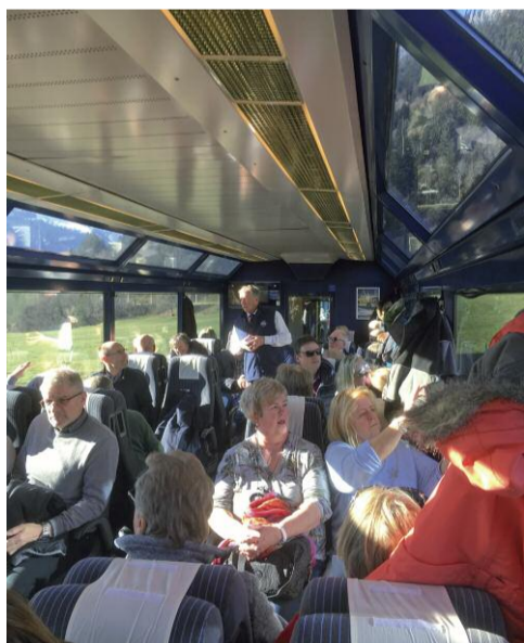
Die Gruppe im Glacier Express.

Bestens gestärkt ging es bergan zum Weihnachtsmann in der Felsgrotte – idealerweise mit der Zahnradbahn hinauf zum Rochers-de-Naye, denn da residiert sehr zur Freude der Eidgenossen und Besucher der vielbeschäftigte Mann ebenso wie in seiner skandinavischen Wirkungsstätte und beeindruckt bei einer stimmungsvollen Audienz im Berg.