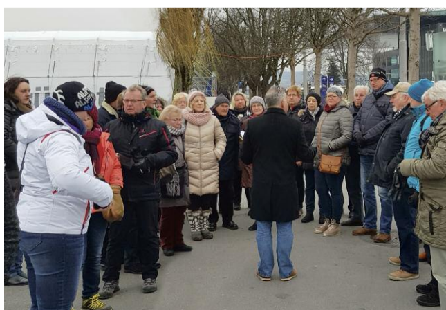
Erläuterungen für die Teilnehmer.

Die Teilnehmer /Innen waren sich nach diesen geballten Eindrücken sicher: Die Schweiz im Winter inklusive Weihnachtsstimmung – eine Erfolg garantierende Story für den Reisebus. So man sich auf leistungsstarke Partner stützt und die Nebenkosten wohlkalkuliert im Griff behält.