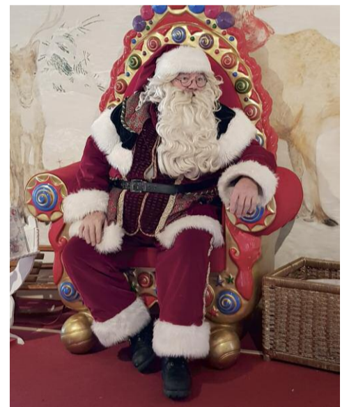
Beim Weihnachtsmann in der Felsengrotte.

Doch das sollte nicht das einzige Bergerlebnis sein – denn am nächsten Tag wurde nach einer entspannenden Schifffahrt von Luzern nach Vitznau via Bergbahn in Angriff genommen, die Rigi. Nicht von ungefähr gilt sie als Königin der (Schweizer) Berge, denn hier bot sich ein wahrhaft grandioser Rundumblick, die man bei einem zünftigen Mittagessen ausgiebig genießen konnte.