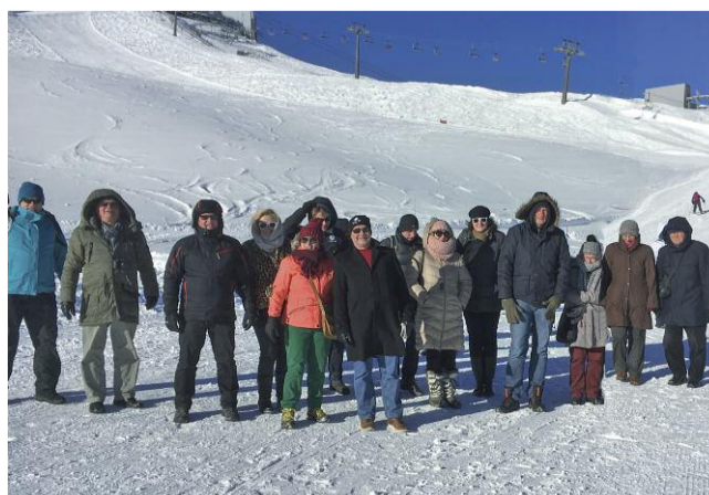
Ein Teil der Gruppe auf 3000m Höhe.